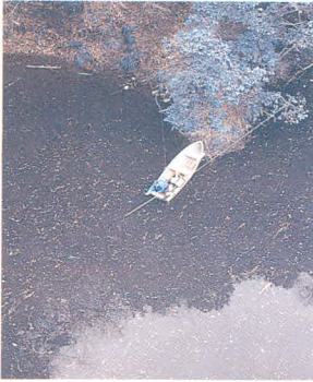
Editor in chief 細田雄治 Executive Editor 大場勝良 Editor 目黒章道/下木達男 Illustrator 吉田育生 Layoutor 野見山泰生/根本小百合/嶋田修治/吉田清美