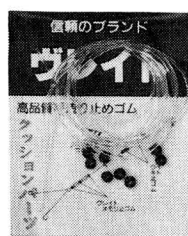
●クッションパーツ ゴム1m、リング8コ ラベル/藤色