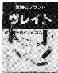
●クッションゴム・小 3コ入り ラベル/藤色