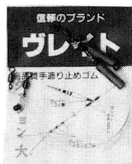
●クッションゴム・大 2コ入り ラベル/藤色

新発売 数々のアイデア商品を製造開発するグレイトから新発売された「クッションゴム」は、ハリス切れトラブルを防ぐ。クッションをバッグに装着できる「ザブバンド」も好評ノ