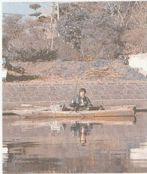
Editor in chief 細田雄治 Executive Editor 大場勝良 Editor 目黒章道/下木達男 Illustrator 吉田育生 Layouter 野見山泰生/根本小百合/嶋田修児/吉田清美