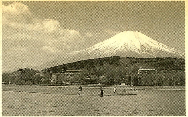
ブラックバスファンは、ピギナーといえども、知識が豊富

が、たくさんいるということである。そういう人達が、まず最初に何をやるか、それは、入門書や雑誌を読み漁ることである。今の若い人は、パソコンや複雑なゲームのマニュアルをさらりと読んで理解してしまうから、はじめて釣り場へ出かける時には、すでにベテラン並の知識を持ち合わせていても不思議ではない。これはブラックバスに限らず、へら鮎釣りの若い人にも言えることであるが、限られた短い時間の中で、物事を習得しようと思えば、当然、勉強は必要なのである。